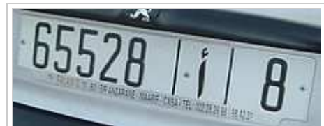
Plaque d'immatriculation marocaine

La plaque est composée de cinq chiffres (de 1 à 99 999) désignant le numéro d'enregistrement du véhicule, d'une lettre de l'alphabet arabe au milieu incrémentée par rapport au numéro d'enregistrement et de l'identifiant de la préfecture d'émission de la plaque (allant de 1 à 88).