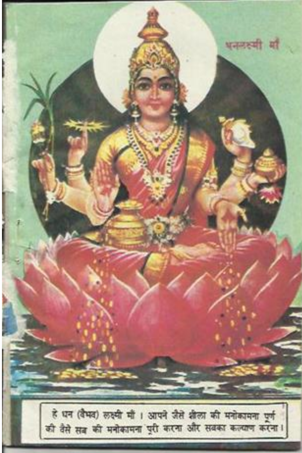
१. धन लक्ष्मी अथवा वैभव लक्ष्मी स्वरूप